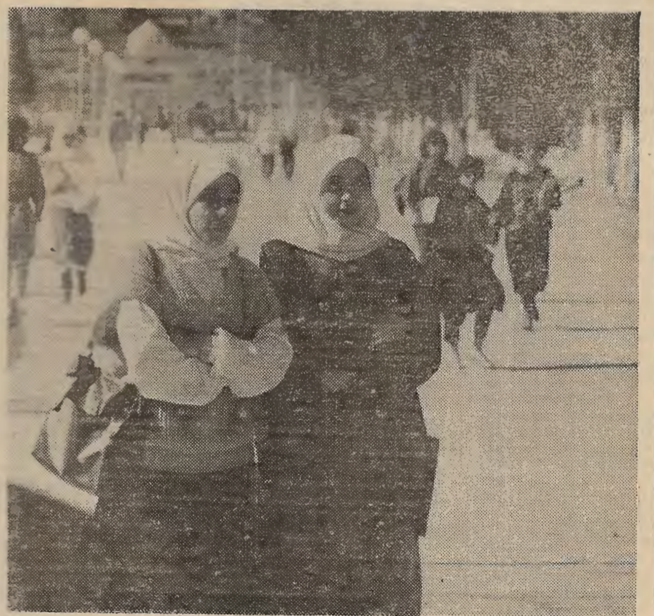
Иордания. Подготовка квалифицированных специалистов — залог успешного развития национальной экономики. Расширению системы образования в стране уделяется большое внимание.